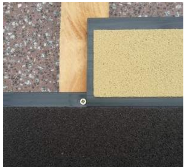
Befestigung mit Schraube