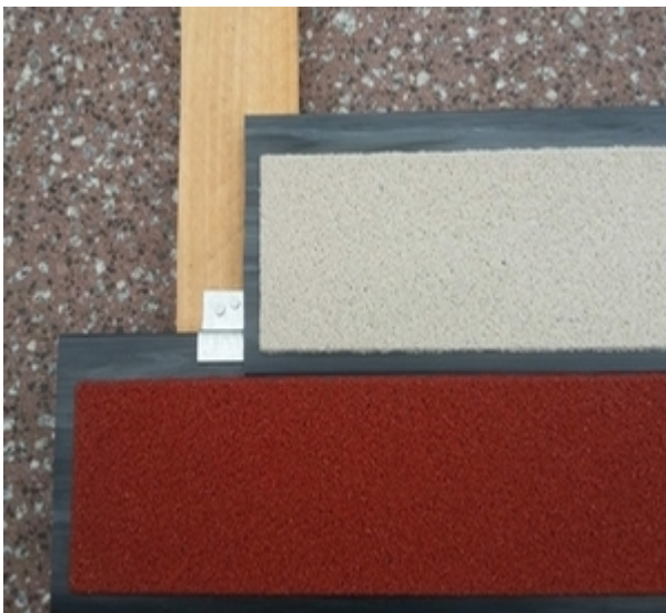
Befestigung mit Klammer